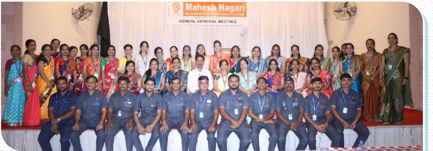
संस्थेचा कार्यक्षम स्टाफ