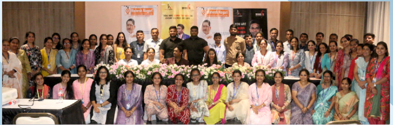
संस्थेतील सर्व स्टाफ करिता ट्रेनिंग प्रोग्रॅम आयोजित करण्यात आला