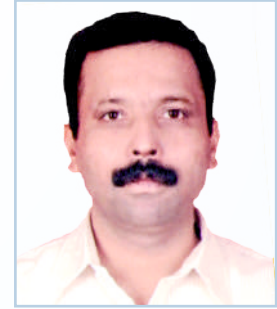
पहलगाम येथील आतंकवादीच्या हल्ल्यात संस्थेचे सभासद