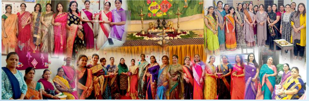
संस्थेचे मुख्य कार्यालय व इतर शाखांमध्ये महिला सभासदांकरिता मकर संक्रांती निमित्त हळदी-कुंकु कार्यक्रम आयोजित करण्यात आला