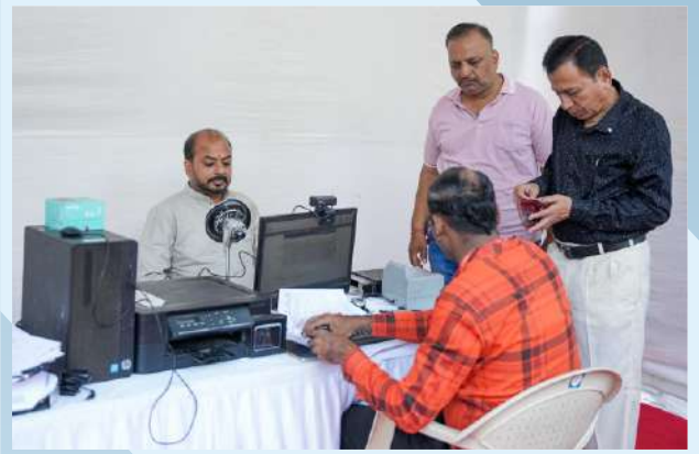
वार्षिक सर्वसाधारण सभेच्यावेळी सभासदांसाठी नवीन आधार कार्ड नोंदणी व दुरुस्ती आणि नवीन मतदार नाव नोंदणीचा उपक्रम राबविण्यात आला त्यास सभासदांचा उत्स्फूर्त प्रतिसाद मिळाला