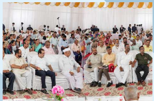
संस्थेच्या मागील वार्षिक सर्वसाधारण सभेतील उपस्थित मान्यवर व सर्व सभासद